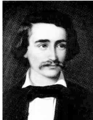
Julius Wilhelm Richard Dedekind 1831—1916, Alemania

Dedekind publicó en 1863 el libro Vorlesungen über Zahlentheorie (Lecciones sobre teoría de números) basado en notas de Dirichlet. En ediciones posteriores (1879) Dedekind agregó suplementos a este libro en los que introdujo por primera vez la noción de ideal, en el contexto de los anillos de enteros algebraicos.